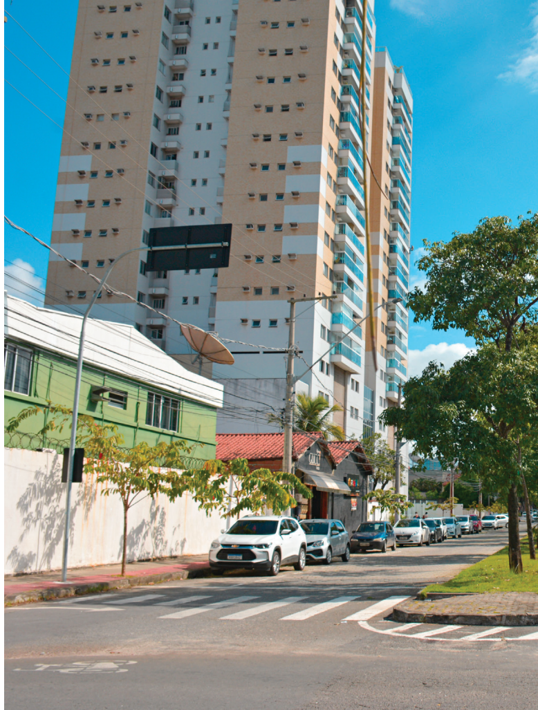
Vista da Rua Carlos Moreira Lima, em Bento Ferreira